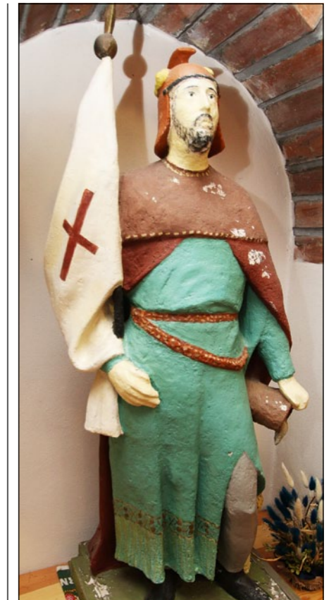
Svatý Florián původně stál venku ve výklenku zbrojnice, až při její rekonstrukci hasiči v klubovně vybudovali vnitřní výklenek, svého patrona přenesli pod střechu. Soška je totiž ze sádry, sucho a teplo v klubovně patronovi svědčí lépe. Netuctový Florián je rovněž zobrazen na novém spolkovém praporu.