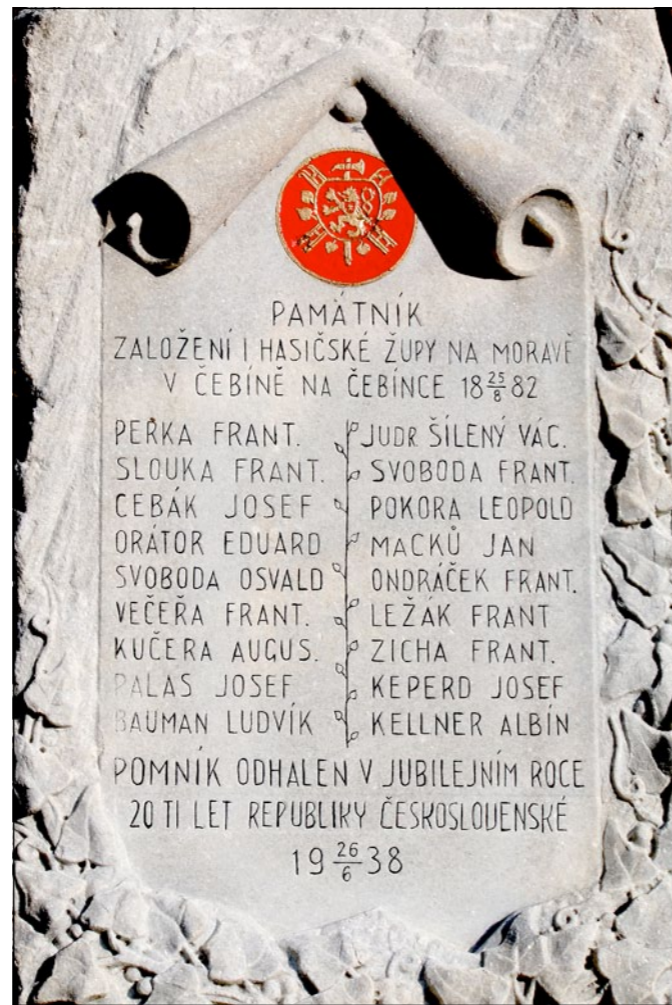
I když památník připomíná půlstoletí od založení první župy na Moravě v roce 1882, odhalen nebyl přesně po padesáti letech, tedy v roce 1932, ale o šest let později – 26. června 1938, u příležitosti 20. výročí zrodu Československé republiky

Redakční úvodník se odvolává na Masarykův projev v Brně 21. října 1921, kde k zástupcům moravského hasičstva první prezident republiky řekl: „Vaše tichá, nehluká, ale velmi důležitá organizace je mi dobře známa. Buďte ubezpečeni, že šlechtetná snaha vaše budu vždy podle svých sil podporovati.“